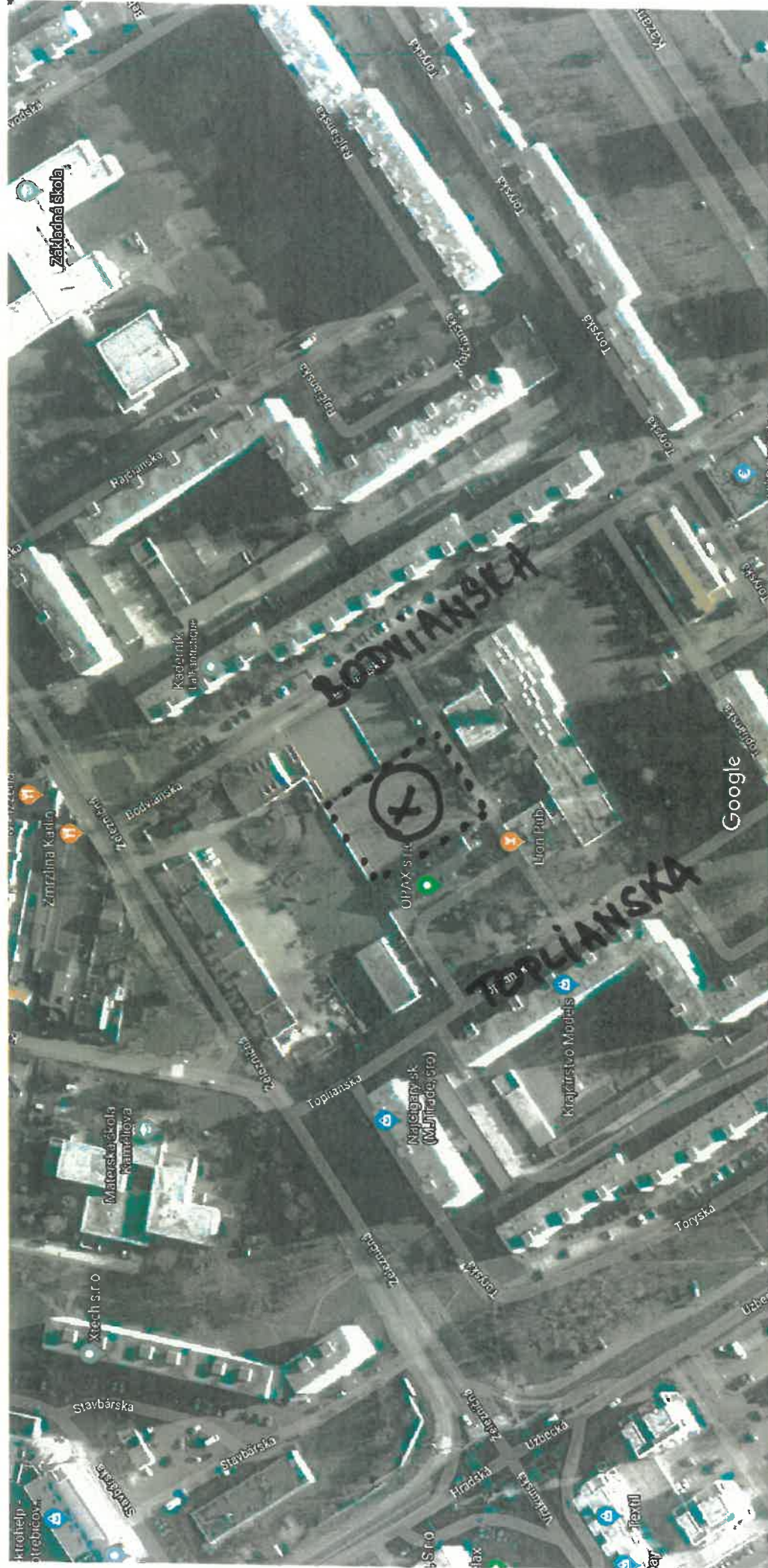
Snimky © 2019 CNES / Airbus, DigitalGlobe, European Space Imaging, Eurosense/Geodis Slovakia, Údaje máp © 2019 Google 20 m