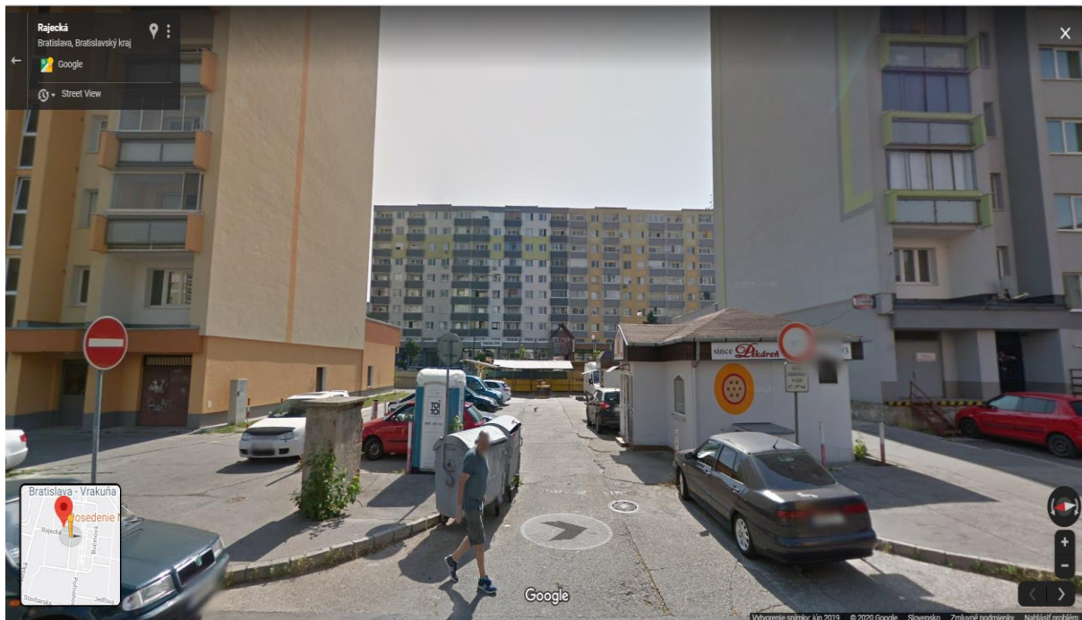
Trhovisko na Rajeckej ul. po zriadení parkoviska