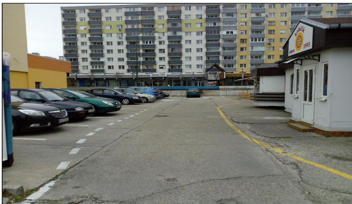
Návrh zriadenia regulovaného parkovania na trhovisku Rajecká