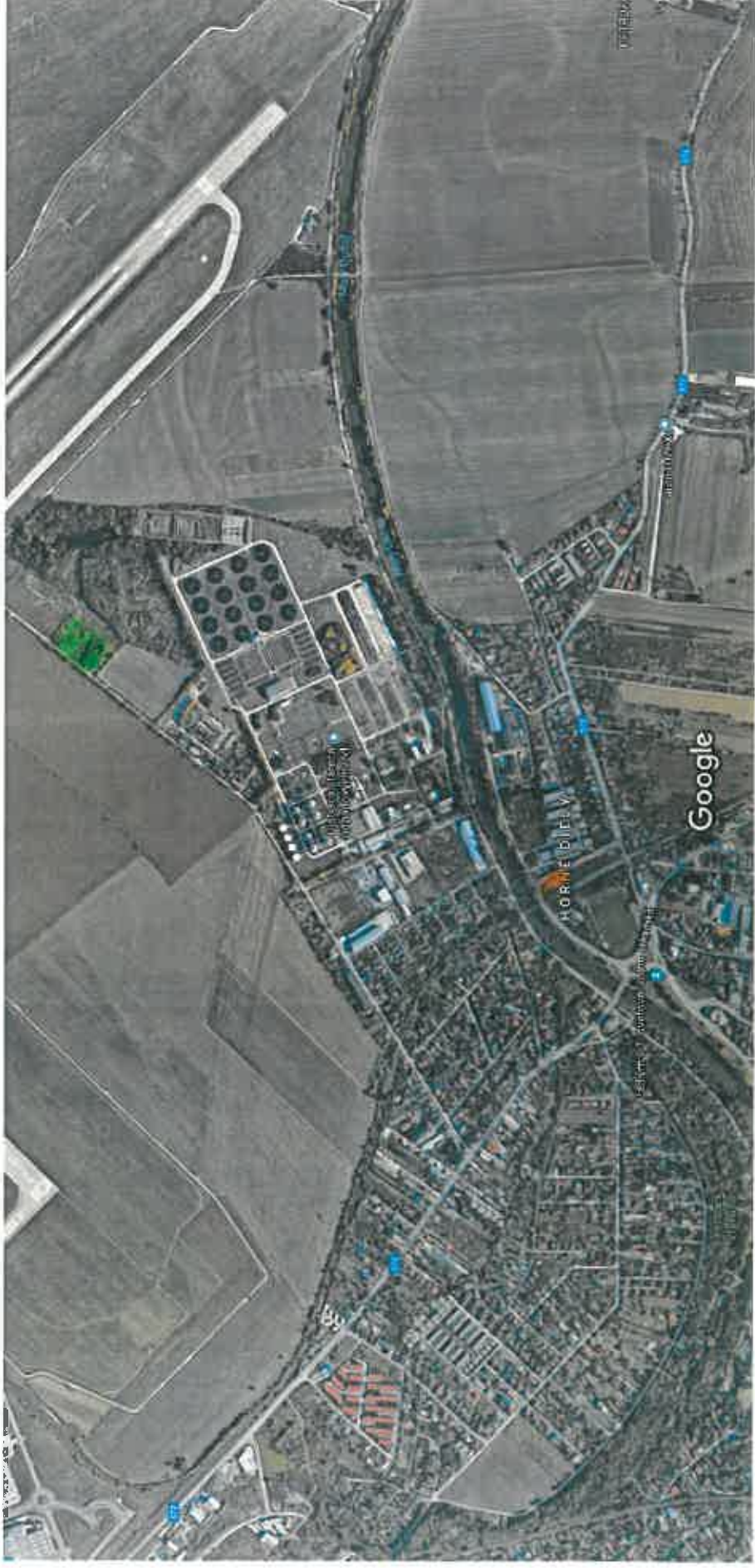
Snímky © 2018 Google, DigitalGlobe, Údaje map © 2018 Google 200 m