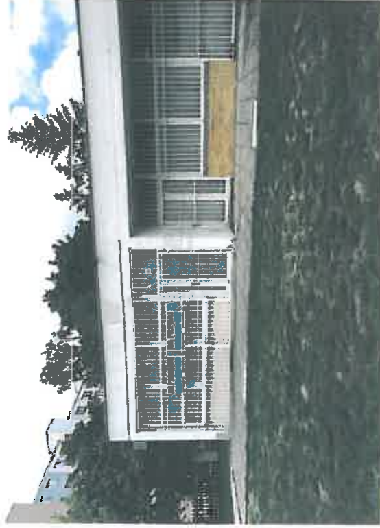
Nebytový priestor č. 12-2a – Toplianska 5 – vlastník spoločnosť TAJPAN s.r.o. Bratislava