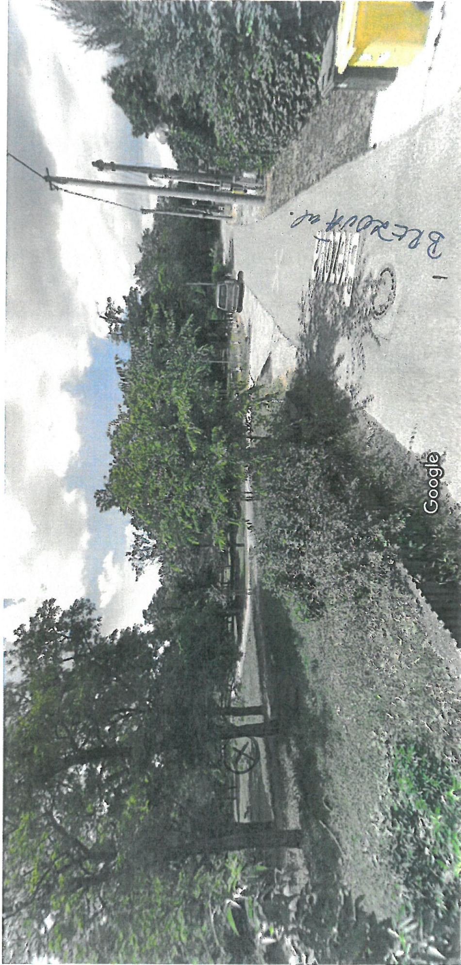
Vytvorenie snímky: júl 2014