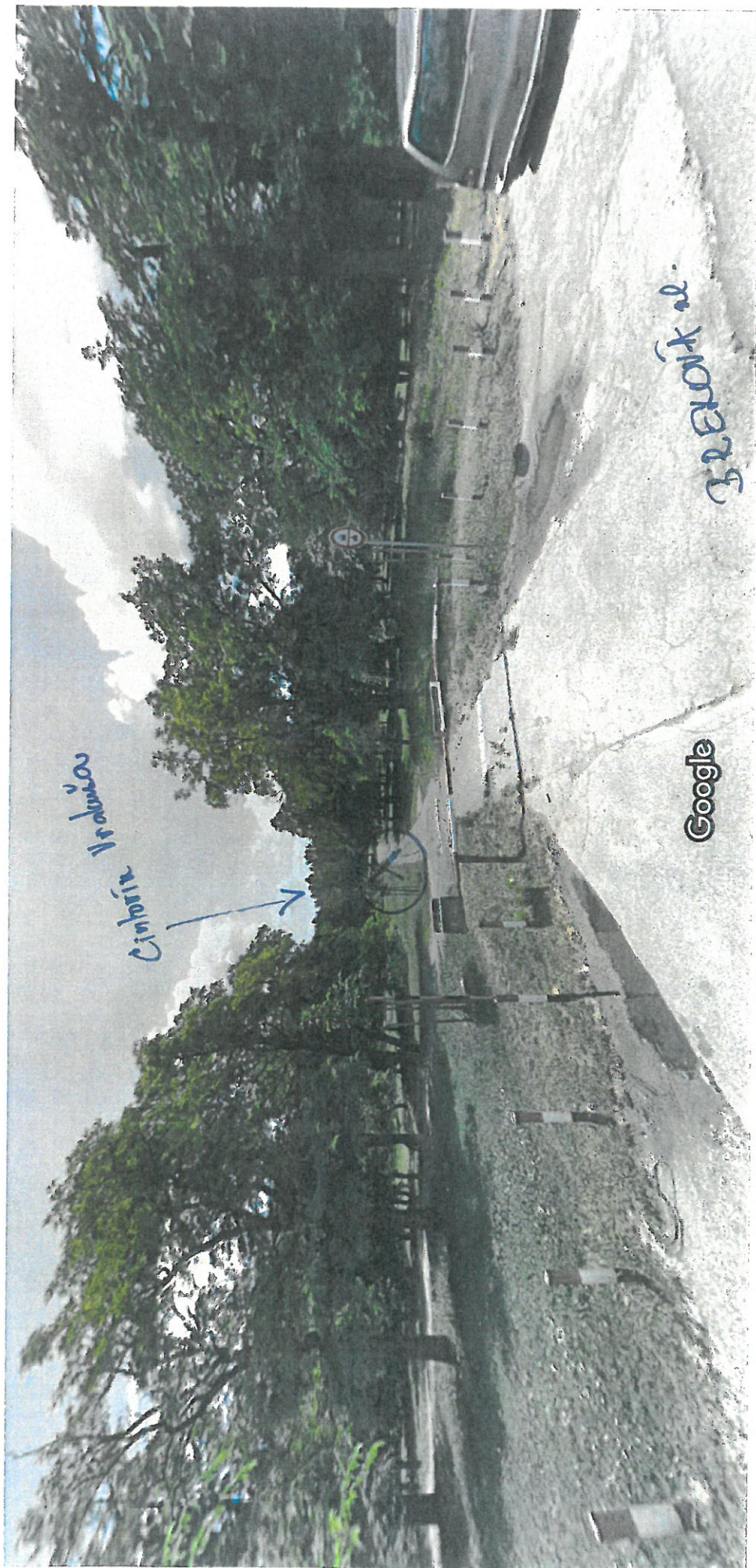
Vytvorenie snímky: júl 2014

Bratislava, Bratislavský kraj Street View - júl 2014