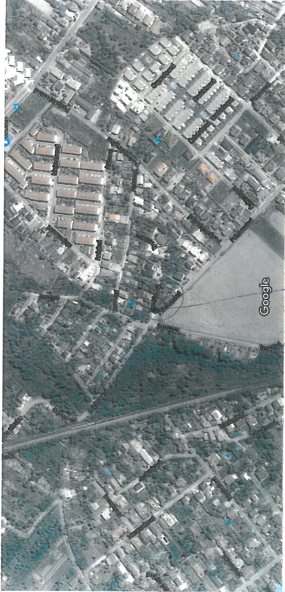
50 m