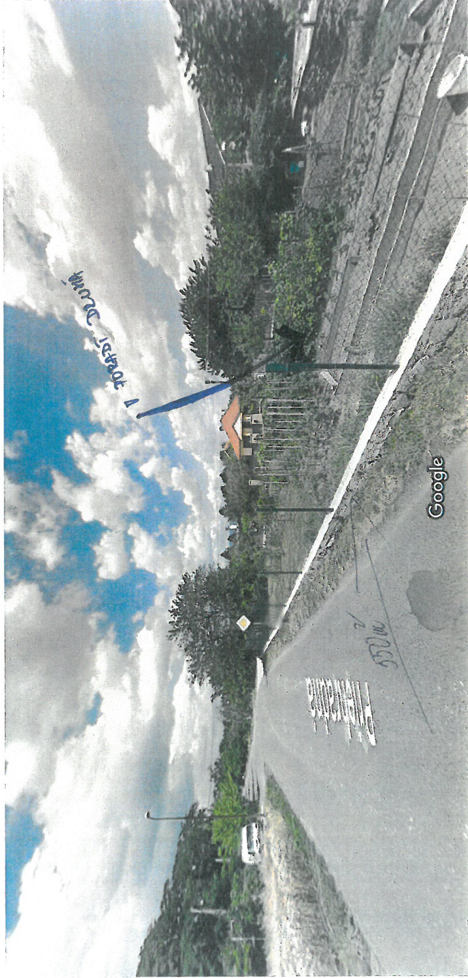
Vytvorenie snímky: júl 2014