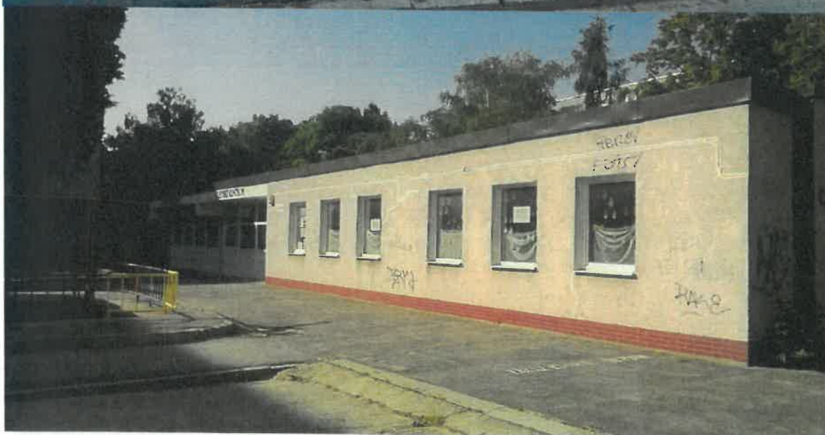
Stavba súpisné číslo 13507 na Čiližskej 26A v Bratislave - stav k 18.5.2020