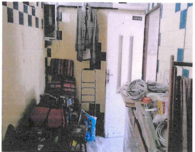
Nebytové priestory - sklad na Bebravskej – nájomca Horínek FEL